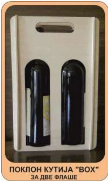
ПОКЛОН КУТИЈА "ВОХ" ЗА ДВЕ ФЛАШЕ