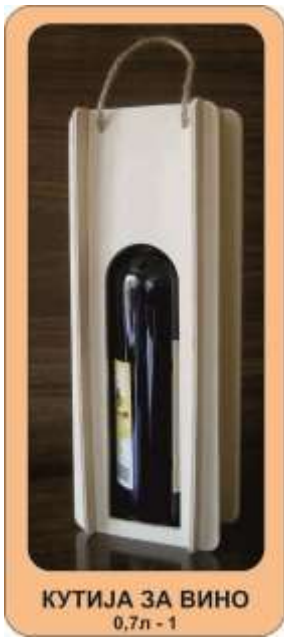
КУТИЈА ЗА ВИНО 0,7л - 1